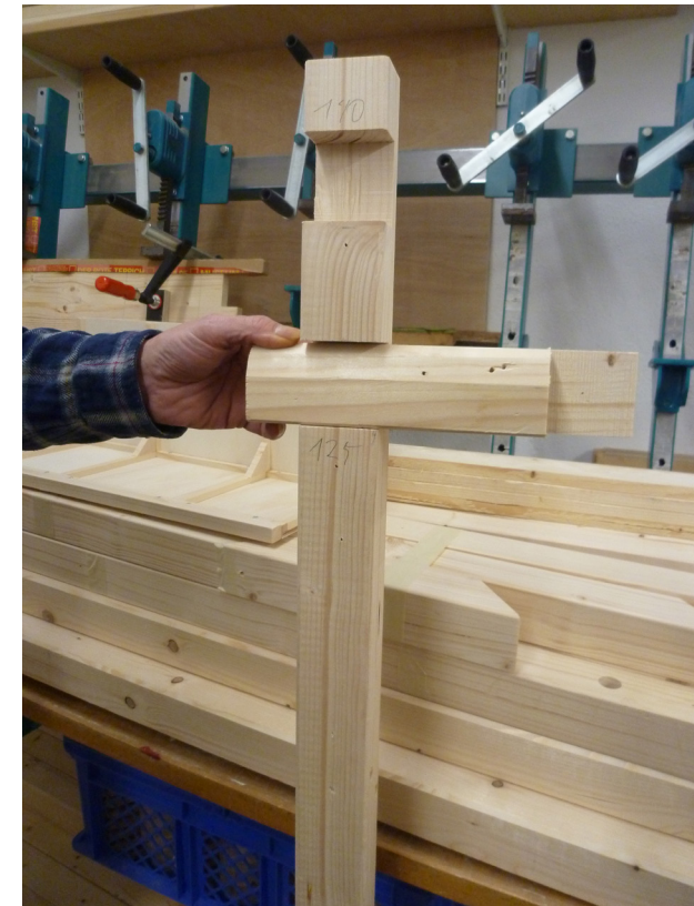
Städtisches Kunstmuseum Spendhaus Reutlingen 12. Juli bis 6. Oktober 2013